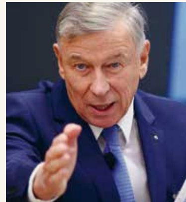
«Die Rechtssicherheit ist ausserhalb der Schweiz nicht immer gegeben.» Mosimann